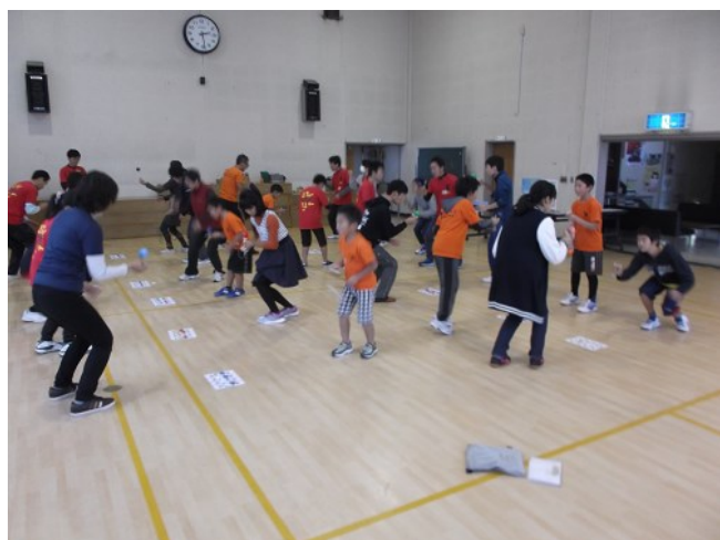
いろいろな人と対戦ができます。

1:30で受付を終了し、対戦カードを組みます。 くれぐれも遅れないようお願いいたします。もし遅れそうなときはご連絡ください。