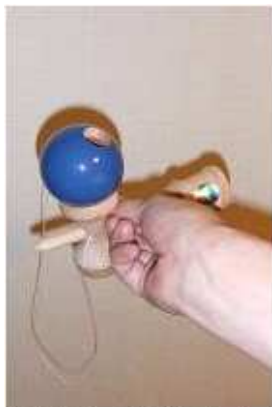
玉を大皿にのせてスタート。