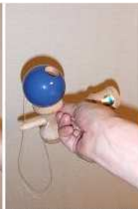
最後に大皿に返って、完成。