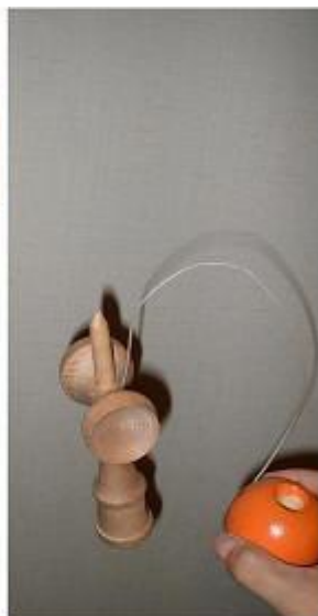
まっすぐ引き上げる