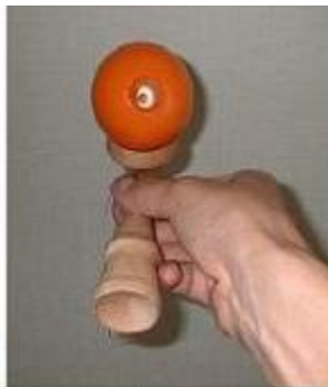
けん先を向こうに