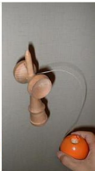
頂上で玉をあてがう