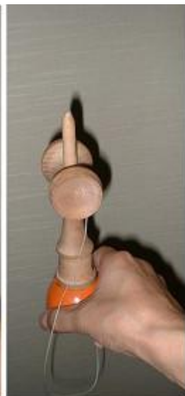
しっかりささえる