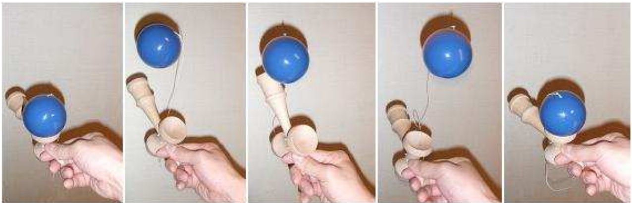
かまえます。 玉を投げ上げ、 けんじりで打って、 落ちてきたら もとにもどします。