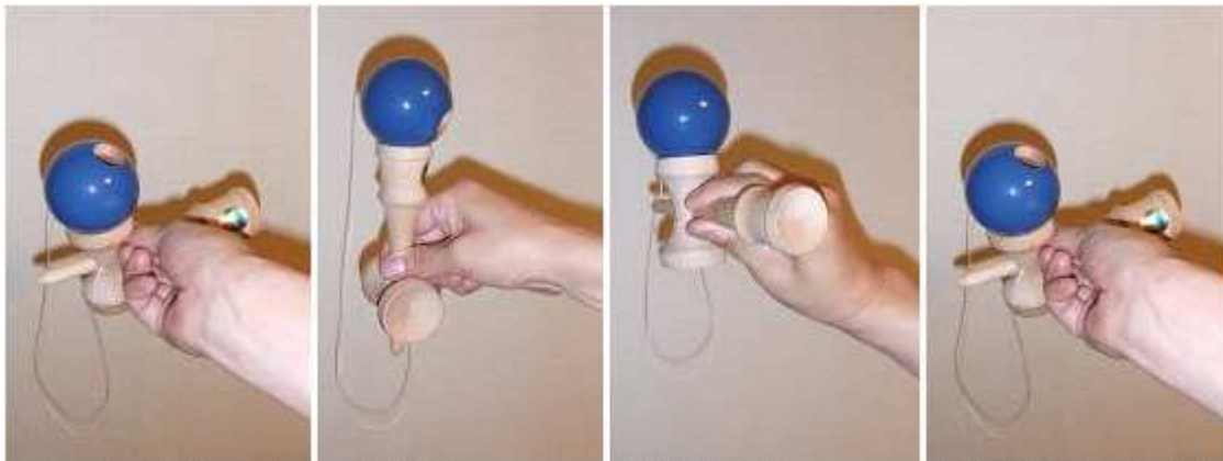
玉を大皿にのせてスタート。 まず中皿に、 つづいて小皿に、 最後に大皿に返って、完成。

◆AB7番 さいりっしゅう 「皿一周」 大皿⇒中皿⇒小皿⇒大皿。持ち方は自由です。