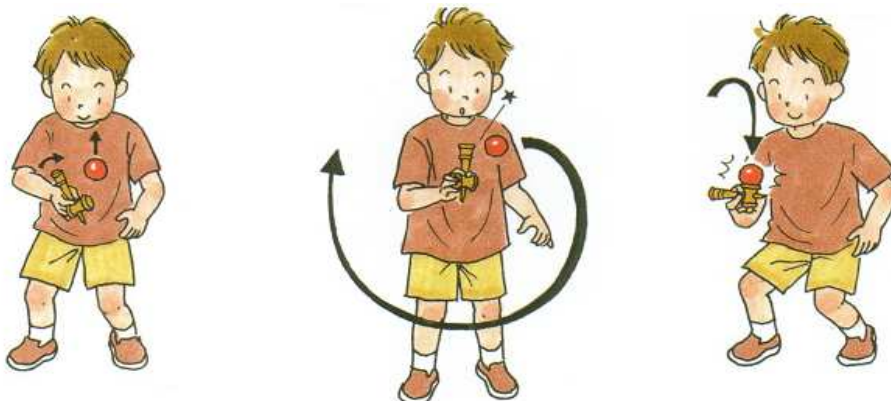
けんじりてカ～ンと打ちます。 グルッと左回りに1周して、 飛んできた玉を大皿に。