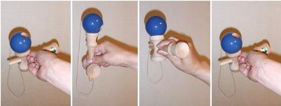
玉を大皿にのせてスタート。 まず中皿に、 つづいて小皿に、 最後に大皿に返って、完成。

◆AB7番 さらいっしゅう 「皿一周」 大皿⇒中皿⇒小皿⇒大皿。持ち方は自由です。