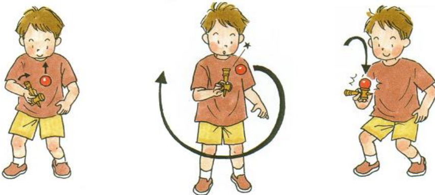
けんじりてカ～んと打ちます。 グルッと左回りに1周して、 飛んできた玉を大皿に。