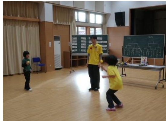
予選のあとはトーナメント戦です。