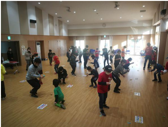
いろいろな人と対戦ができます。

せかいはいつ おおずもう ぜんせんしゅそうあ せん 世界初！！大相撲と同じ15日制・全選手総当たり戦！！