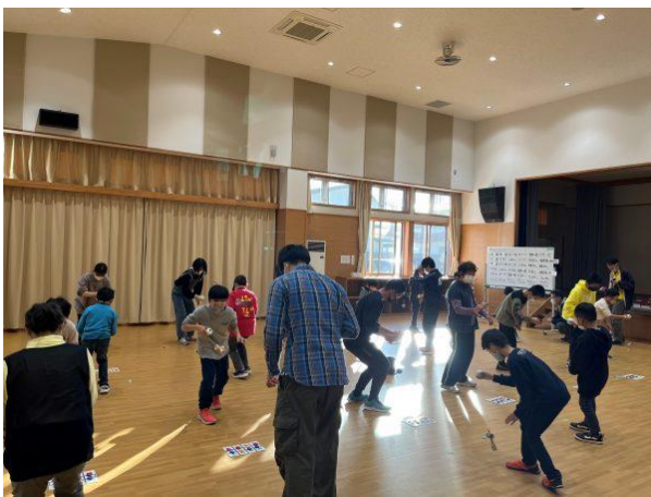
いろいろな人と対戦ができます。