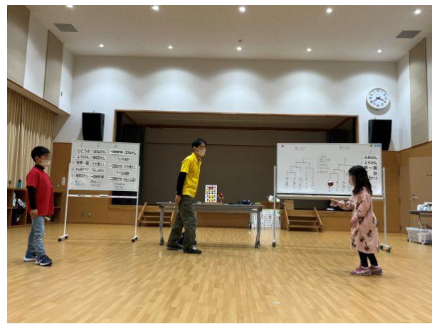
予選のあとはトーナメント戦です。