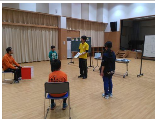
予選のあとはトーナメント戦です。