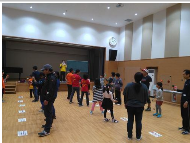
いろいろな人と対戦ができます。

皆さん準備ができ次第、2:30を待たずに 試合を始めます。その分たくさん試合が できるので。受け付けはお早めに。