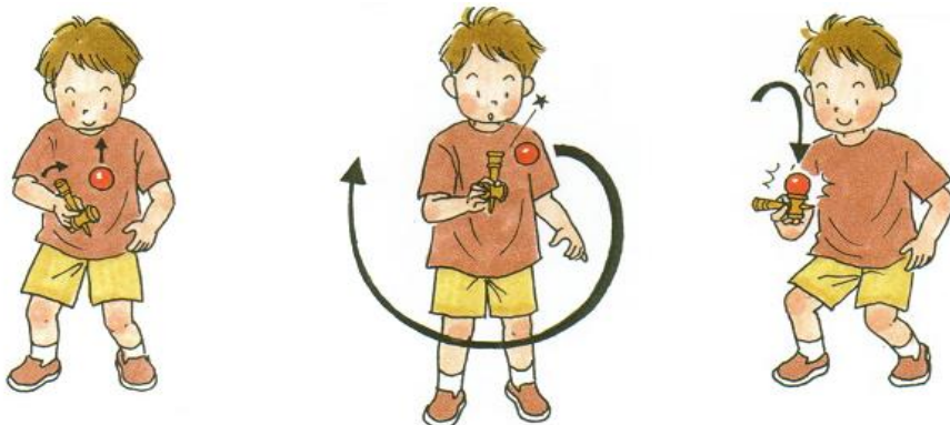
けんじりてカ～んと打ちます。 グルッと左回りに1周して、 飛んできた玉を大皿に。