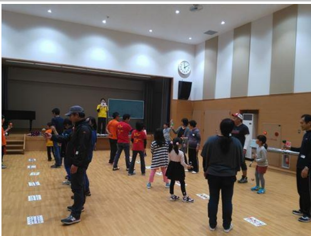
いろいろな人と対戦ができます。

皆さん準備ができ次第、2:30を待たずに 試合を始めます。その分たくさん試合が できるので。受け付けはお早めに。