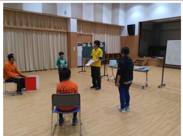
予選のあとはトーナメント戦です。