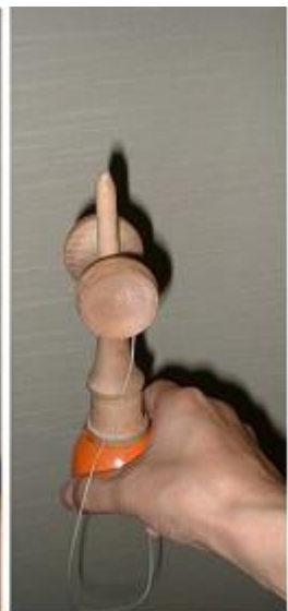
しっかりささえる