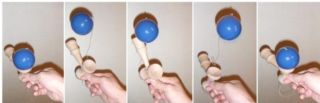
かまえます。 玉を投げ上げ、 けんじりで打って、 落ちてきたら もとにもどします。

「 すべり止め極意 」大皿と小皿をはさんで持って、玉を「すべり止め」というところにのせます。